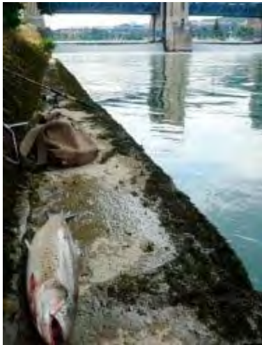
Une truite pêchée dans la Seine devant le barrage de Suresnes

Une truite de mer de belle taille été pêchée le week-end dernier à Paris, fournissant un "indice précieux" de la "santé florissante" de la Seine, a affirmé jeudi l'organisme public chargé de l'assainissement du fleuve.